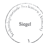
Neuber amtierende Verbandsgemeindebürgermeisterin

Hansestadt Seehausen (Altmark), 16.11.2012