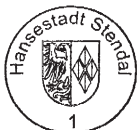
Klaus Schmotz Oberbürgermeister